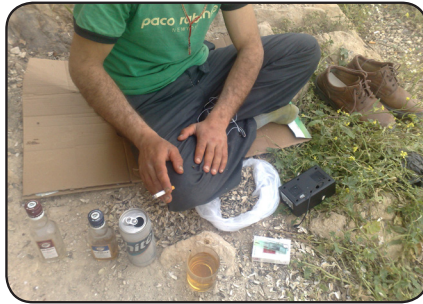
پاشماوهی گه نجه ناهوشیاره کان

ئهم جیگه جیگه یه کی گشتی یه ئهم گه نجه به م شیوه یه کاری تیدا ده کات!