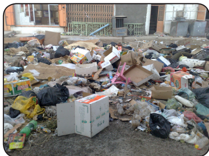
ناو بازارو مالانی که لار