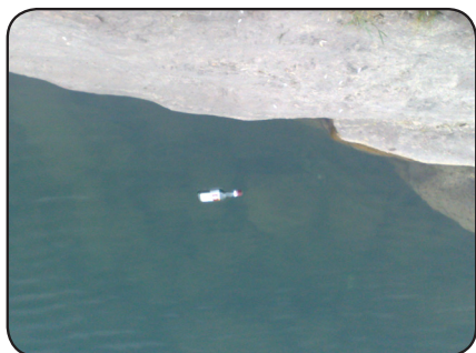
بازاری خانه قین